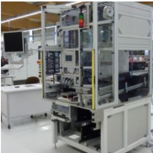
Press-Montage von Stecker-Pins in PCB - Leiterplatten