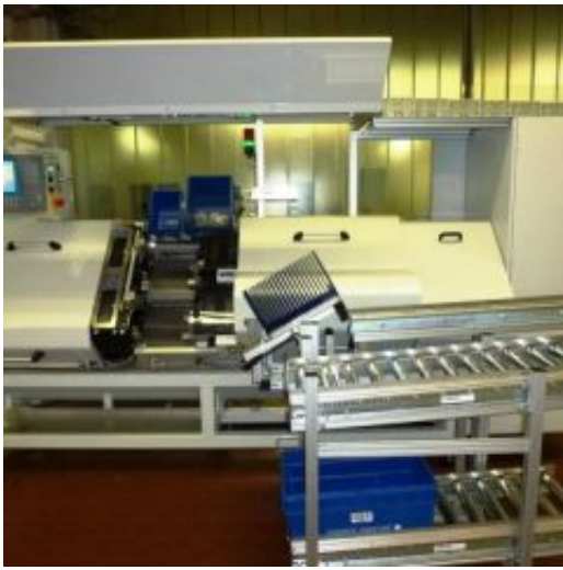
Press-Montage von Abgaswärmetauscher